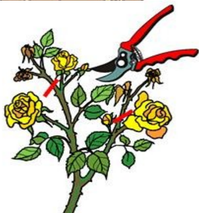
OREZIVANJE PRECVETALIH CVETOVA